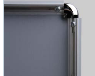
Profilo in alluminio H 180